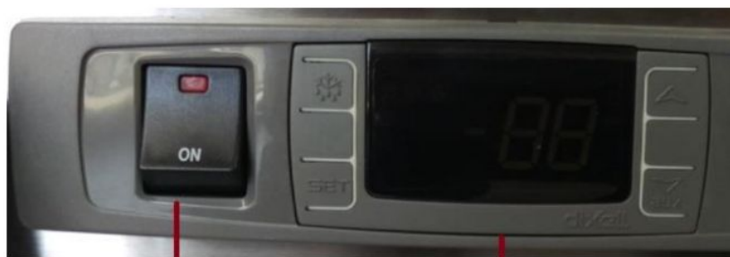
A - Ki/Be kapcsoló gomb B - Thermosztát